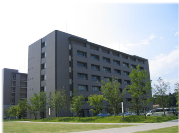
埼玉医大日高キャンパス ゲノム棟 5階 (埼玉県日高市)